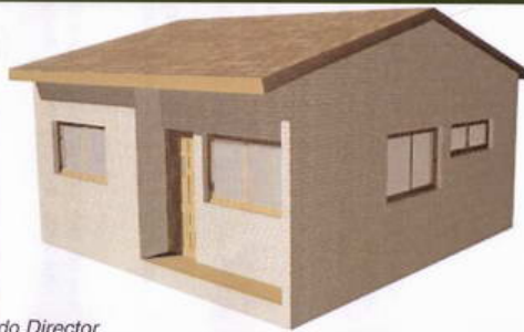
Casa do Director